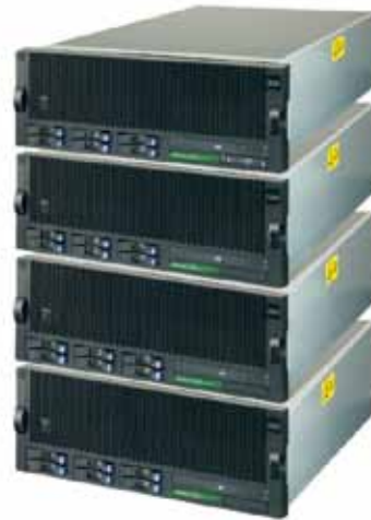
Power 770 모듈형 블레이드 블록

최대 64개의 POWER7+ 프로세서 코어로 구성할 수 있는 이 새로운 버전의 대중적인 모듈형 설계는 이전 모델보다 더욱 뛰어난 효율성으로 더욱 많은 용량을 제공합니다. 결과적으로 시스템당 성능 및 설치 공간당 성능이 증가했으며 무엇보다도 와트당 성능이 향상되었습니다. 또한 이 혁신적인 설계 방식은 선형에 가까운 확장 및 무중단 확장을 지원하므로 투자를 최대화할 수 있습니다. POWER7+ 기술, PowerVM 가상화 및 Power 770은 고객의 IT 환경에 맞는 최적의 조합이 될 것입니다.